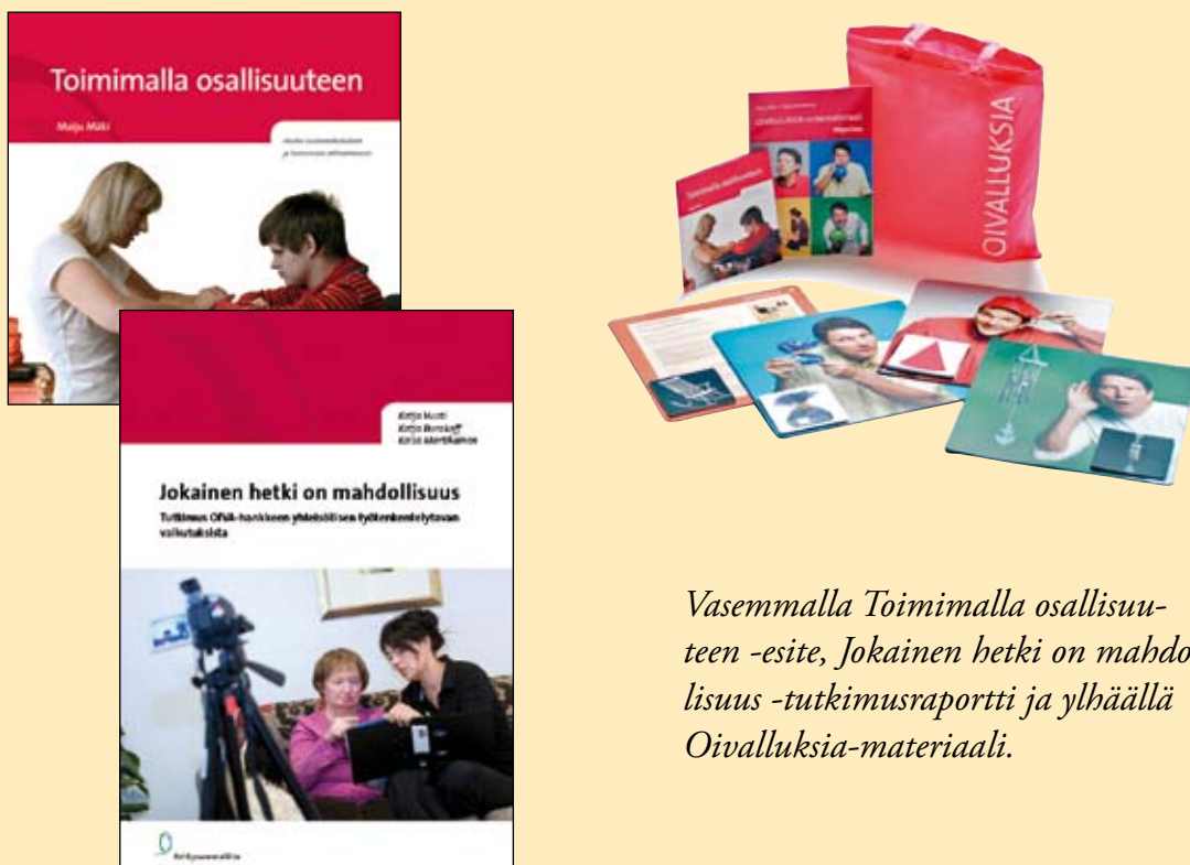
Vasemmalla Toimimalla osallisuuteen -esite, Jokainen hetki on mahdollisuus -tutkimusraportti ja ylhäällä Oivalluksia-materiaali.

Hankkeessa tehtiin tutkimus siitä, miten yhteistyöyhteisöjen ohjauksessa projekti-aiakana käytetty työskentelytapa vaikutti kommunikointiin. Osuudesta julkaistiin tutkimusraportti (Vuoti, Burakoff & Martikainen 2009).