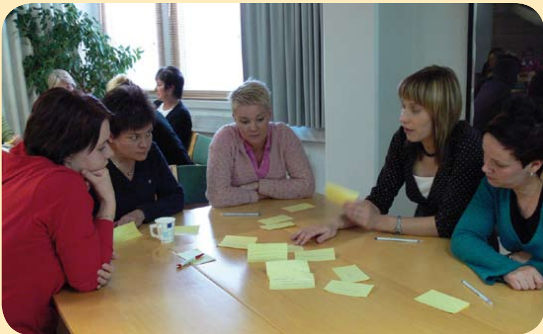
Pohdintaa oivalaisten koulutustilaisuudessa.

Uuden työskentelytavan kehittämisen rinnalla tarkoituksena oli lisätä yhteistyöyhteisöjen henkilökunnan osaamista ja vahvistaa näin vuorovaikutusta yhteisöissä. Tavoitteena oli lisäksi, että oivalletut vuorovaikutustavat jäisivät pysyvästi käyttöön myös hankeajan jälkeen. Yhteisöjä tuettiin tekemään selkeät, tavoitteelliset vakiinnuttamissuunnitelmat. Vastuu toiminnan vakiinnuttamisesta oli yhteisöillä, mutta työntekijöille tarjottiin mahdollisuuksia osallistua toiminnan juurtumista edistävään konsultaatioon ja koulutukseen (liite 5: Neuvottelut ja konsultaatiot yhteistyökumppaneiden kanssa).