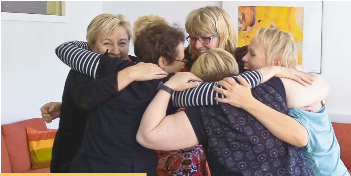
VASTAVALMISTUNEET OIVA-OHJAAJAT VERKOSTOITUVAT.